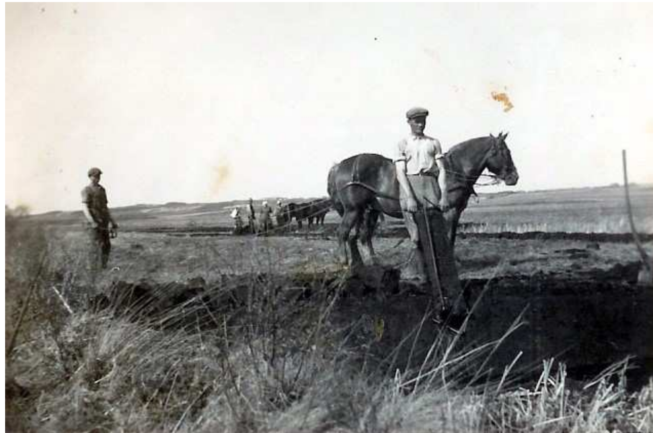
Tørveskæring i Riskjær

De efterfølgende dias, er klippet fra Power Point fra Sogneaften 2010.