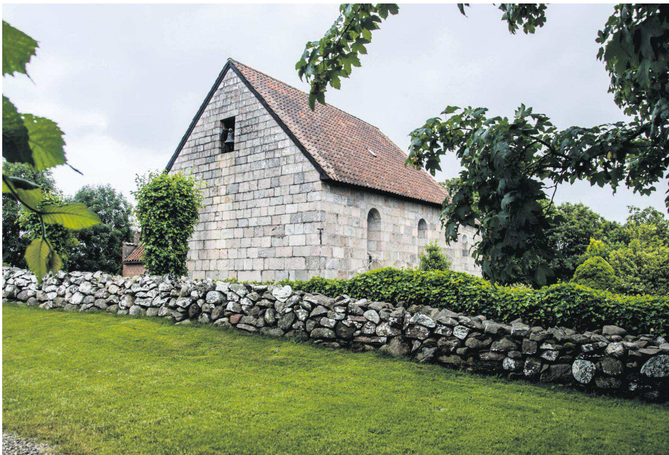
Der er et oprindeligt middelalderpræg over den lille kirke i Pederstrup, fordi den aldrig er blevet udsmykket med et tårn.