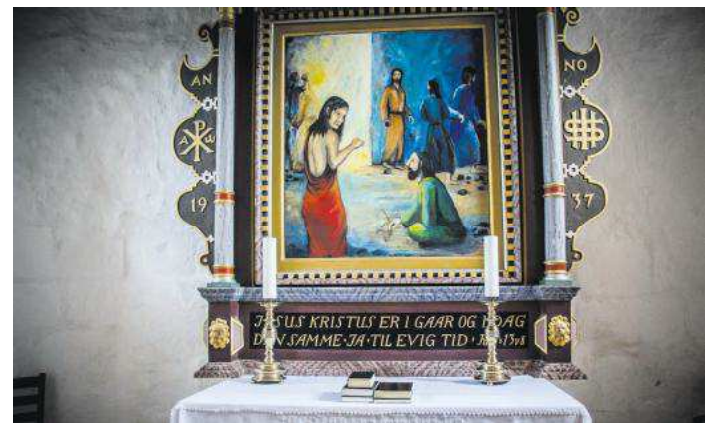
Altertavlen bruges som skifteramme. To malerier af Laila Sørensen hænger over det gamle alterbillede afhængig af tidspunktet på kirkeåret.