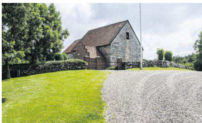
Kirken ligger på en bakke hævet over den omgivende landsby.

|| Sådan så de romanske kirker ud, før de blev opstadset med tårn og kamtakker. Det var alvor dengang.