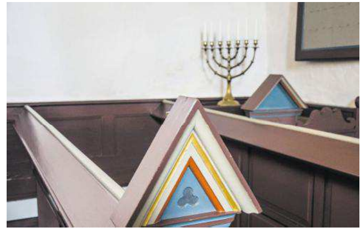
Pederstrup Kirke er bygget i 1100/1200-tallet. Man kan finde lidt forskellige bud på opførelsesåret i litteraturen.