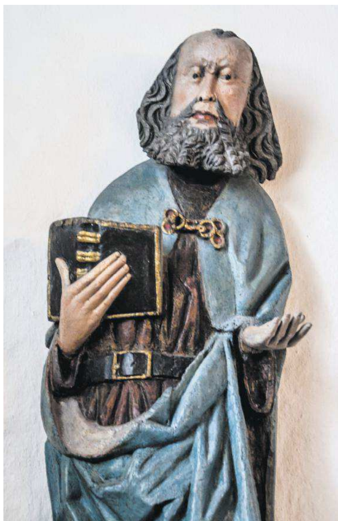
Der er ikke enighed om, hvem denne træfigur forestiller. Apostlen Peter, som har givet navn til kirken, mener nogle.