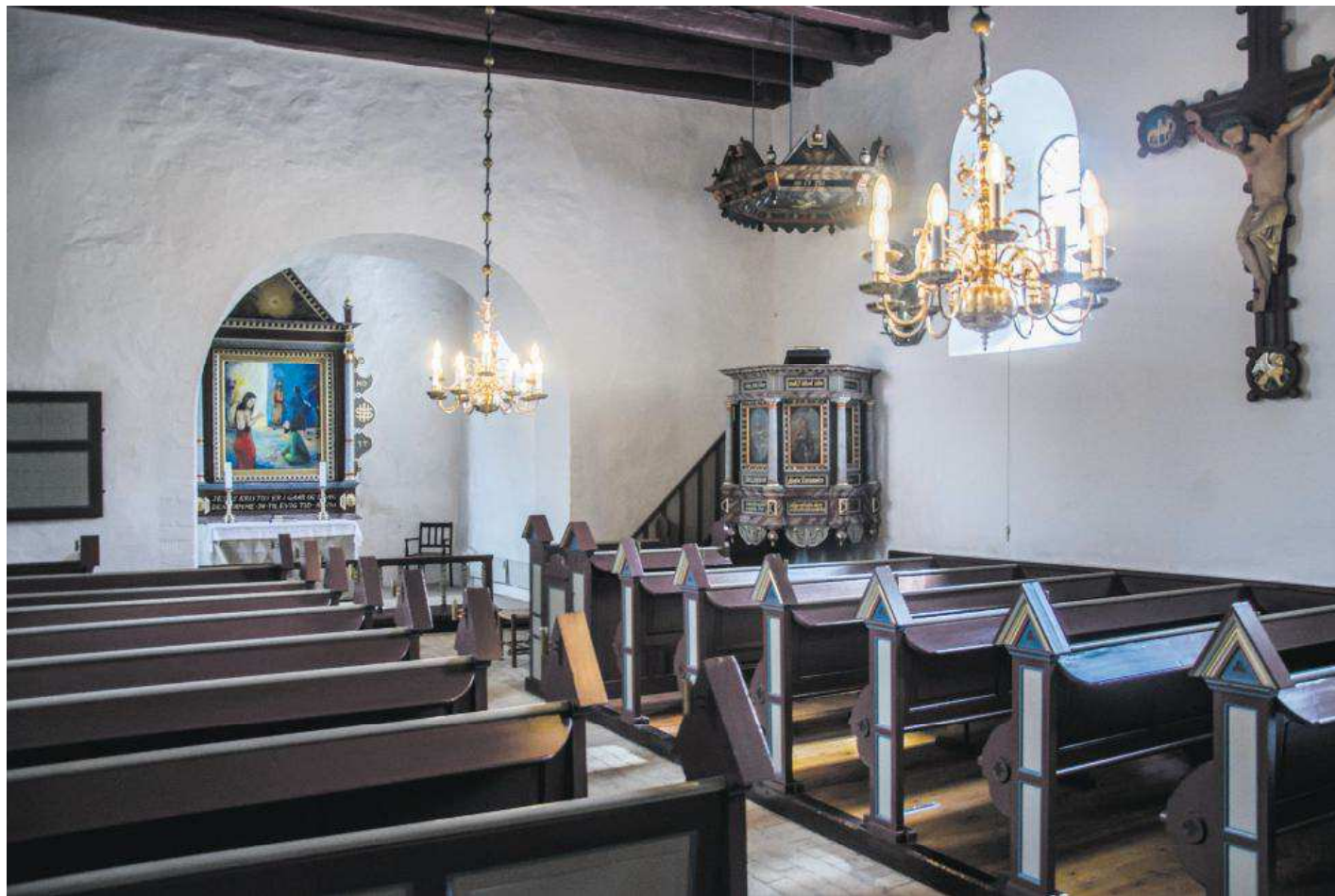
Kirkerummet er lille, men stemningsfyldt. Lyset tændes, når besøgende træder indenfor, og dagen lang lyder der gregoriansk munkesang i kirkerummet.