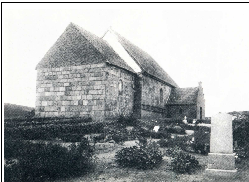
Der er ikke sket store forandringer i Pederstrup Kirke ydre siden 1920-erne, men læg mærke til, at landskabet omkring kirken var næsten helt uden træer. På billedet her ser man også, som lærer Dalum skriver, at kirkegården består af næsten rent sand.

kaldende, gækkende fuglerøster overalt i skoven. Stormen har revet nogle slemme huller i "taget". Stubbene står endnu, men med nye livskraftige skud imellem. Der ligger en rund kæmpehøj med træer på. Der er stedet til en talerstol. Laust er steget op på den, men får intet sagt. Børnene råber alligevel hurra for ham, så det svarer igen fra alle kanter. Vi synger "Jeg elsker de grønne lunde", og traver videre. Ingen er trætte. Der